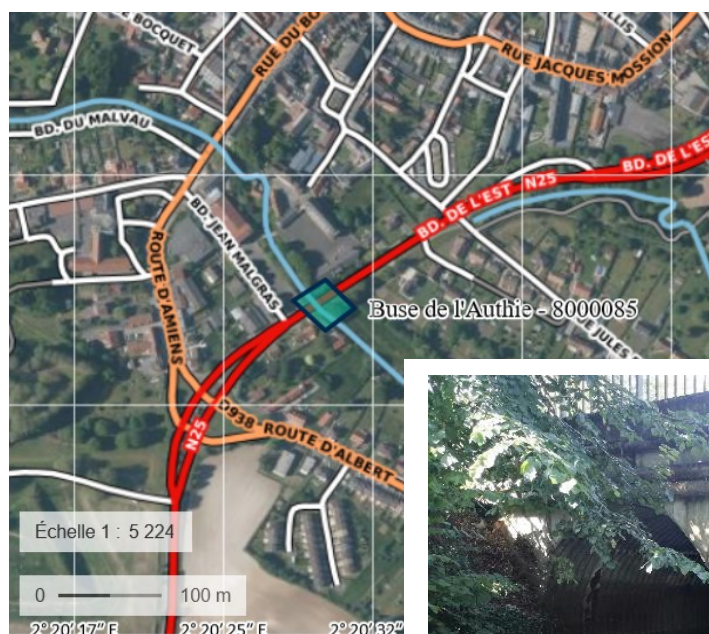
Plan de situ

La présente consultation concerne un ensemble de prestations intellectuelles en lien avec la réhabilitation de l'ouvrage 80-N25 (double buse métallique) permettant le passage de l'Authie sous la N25 sur la commune de Doullens au PR35.