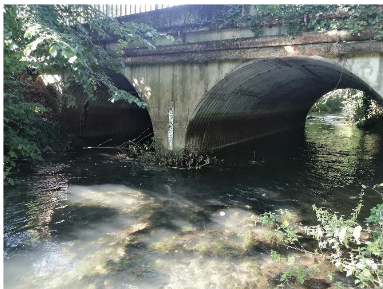
Vue depuis l'amont